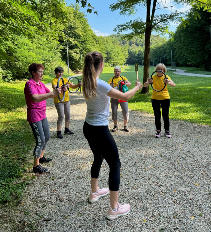
Telovadba v Krškem