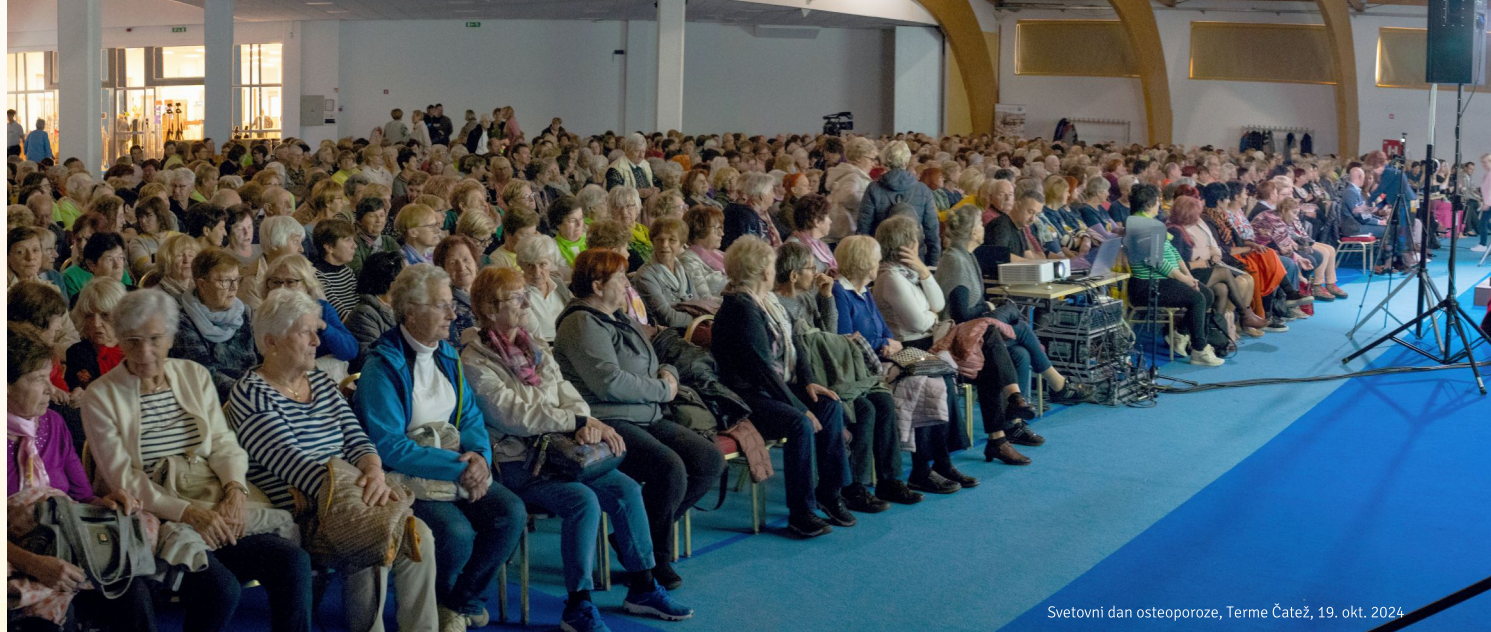
Svetovni dan osteoporoze, Terme Čatež, 19. okt. 2024