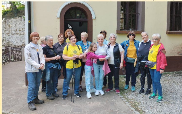
Kostanjeviška skupina v Lurdu, 2024