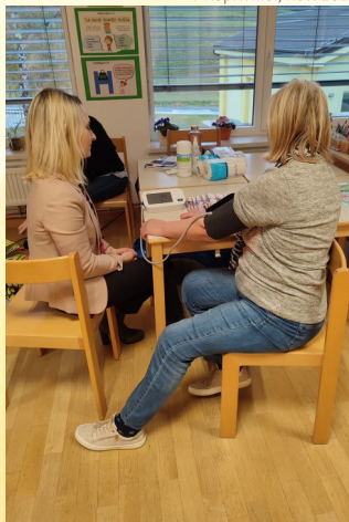
V Koprivnici, nov. 2024