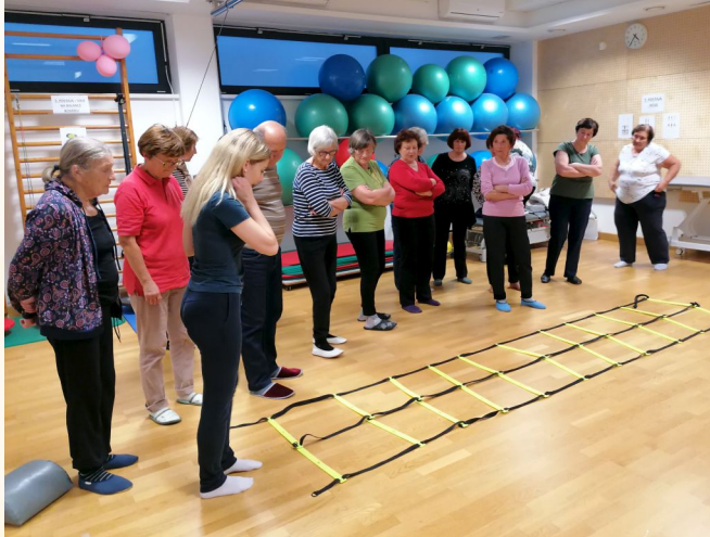
Vadba v ZD Sevnica, januar 2024