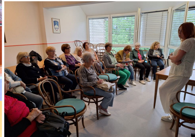
Klubsko popoldne – nega kože, jun. 2024