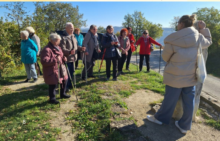
Na izletu - Krkavški kamen, nov. 2024