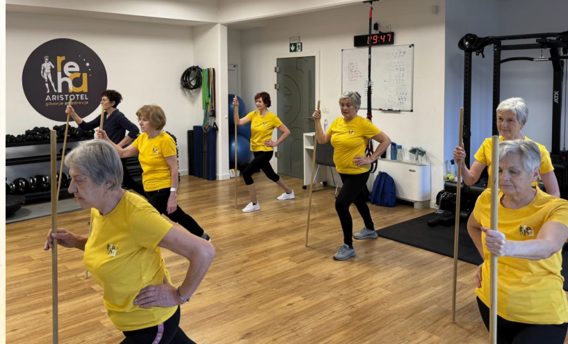
Vadba v ZC Aristotel Krško, januar 2024