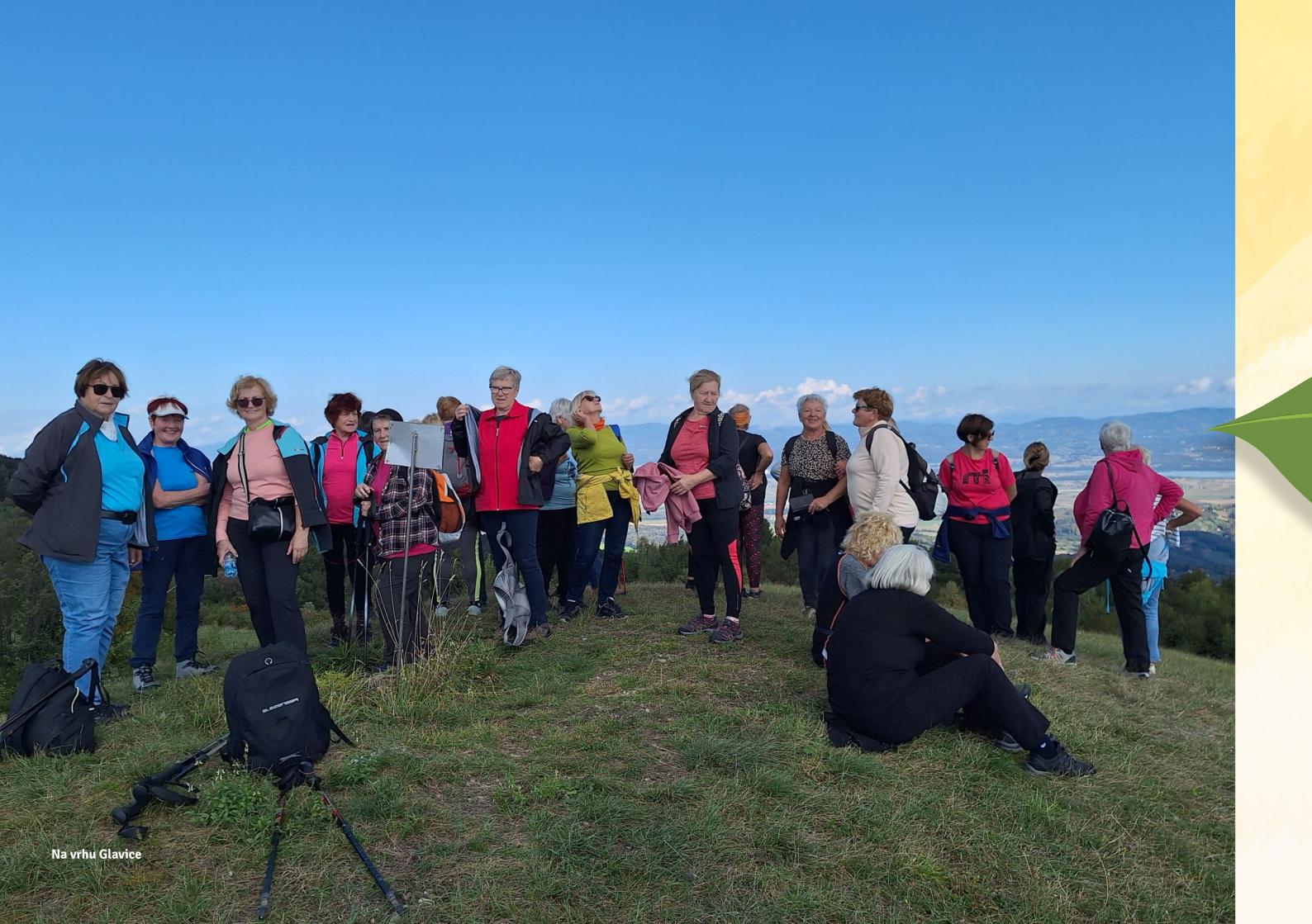
Na vrhu Glavice