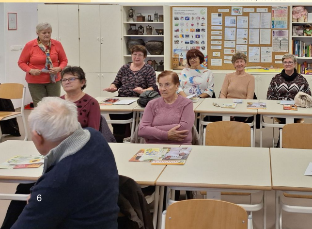
Na Blanci, nov. 2024