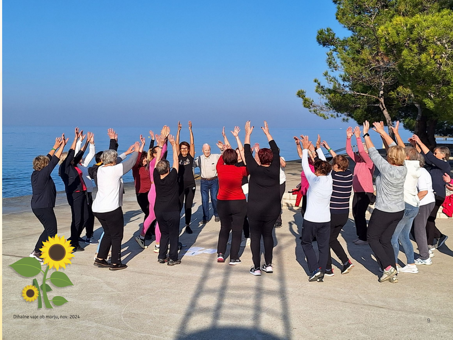
Dihalne vaje ob morju, nov. 2024