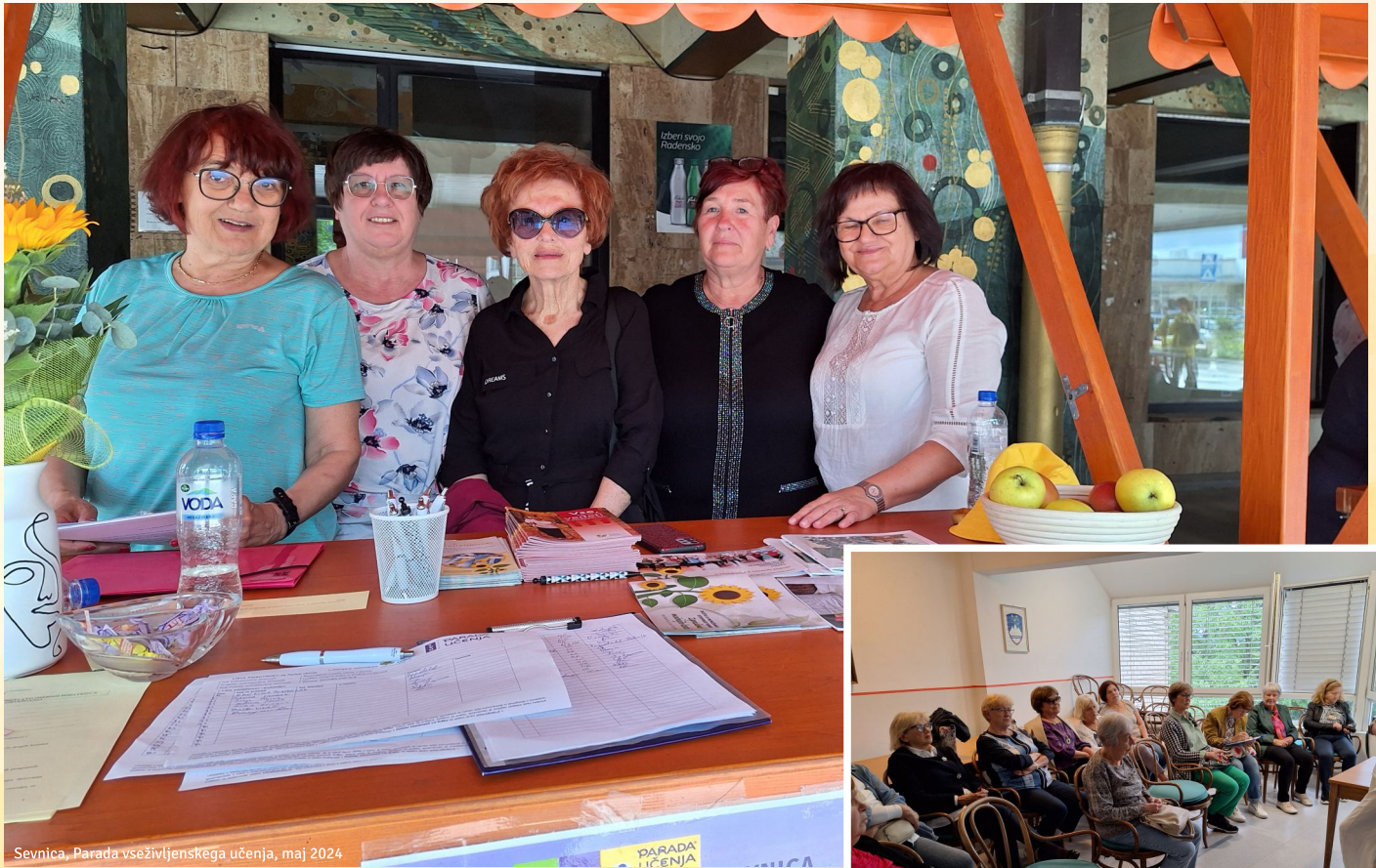
Sevnica, Parada vseživljenjskega učenja, maj 2024