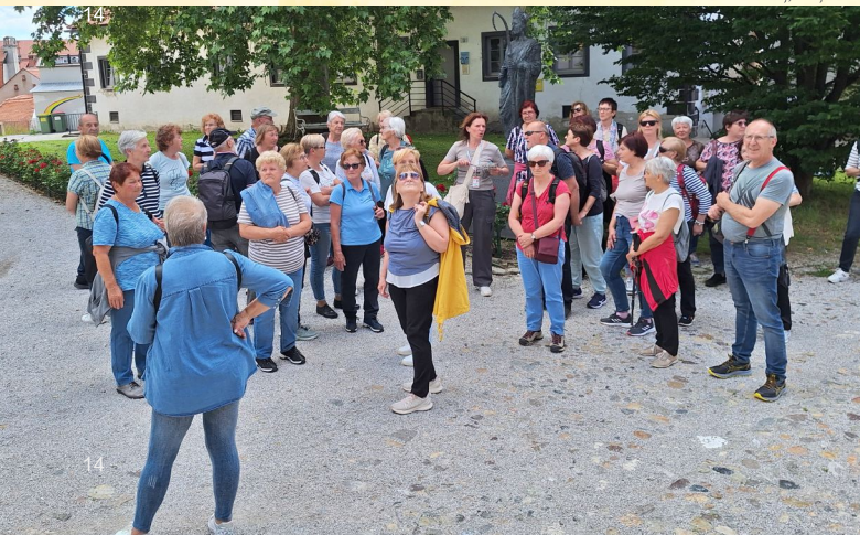
Izlet na Ptuj, maj 2024